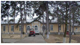
Spitalul vechi din satul Lădești

Monument de arhitectură. Categorie valorică B;