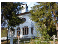
Biserica Sfinții Voievozi din satul Măldărești